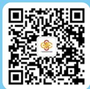
广东投资者教育与服务