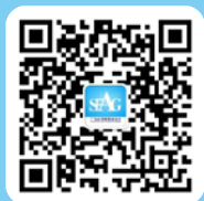
广东证券期货业协会