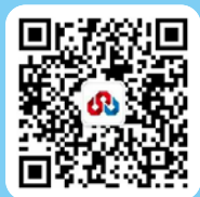
中证资本市场法律服务中心